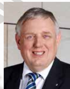
Staatssekretär Karl-Josef Laumann

Beauftragter der Bundesregierung für die Belange der Patientinnen und Patienten sowie Bevollmächtigter für Pflege